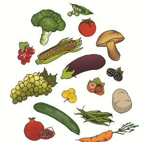
Fruits & légumes de Septembre

sur la planète Agissons pour la planète Agissons pour la planète Agissons pour la planète